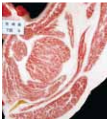
美穂国×福桜(宮崎)×安平