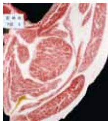
美穂国×勝平勝×上福