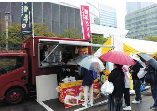
キッチンカー (大阪府堺市：南海グリル)