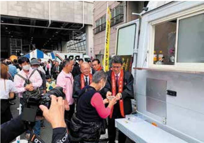
ふるまい(宮崎牛のしゃぶしゃぶ)