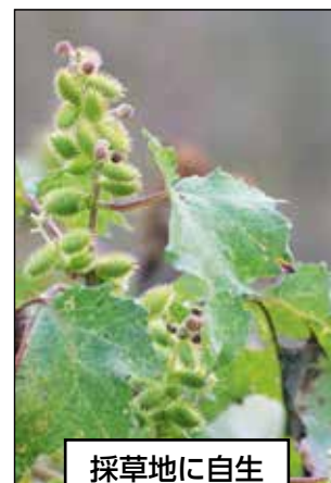
採草地に自生するオナモミ