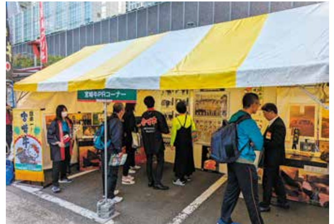
宮崎牛 PR コーナー