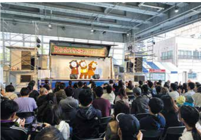
みやざき犬ダンスステージ