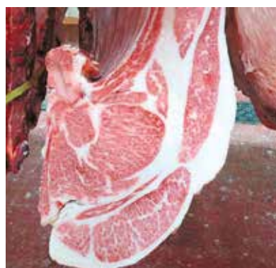
グランドチャンピオンに輝いた枝肉

審査報告では、「ロース芯面積が大きく、形状も良好で、バラの厚さ、特に腹鋸筋に厚みがあり、周囲筋の僧帽筋や広背筋も厚みがあるなど全体のバランスが優れていました。