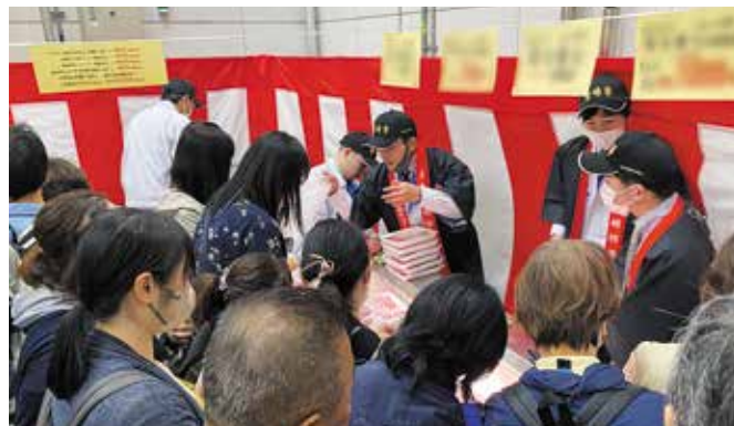
宮崎牛の販売(店舗内)