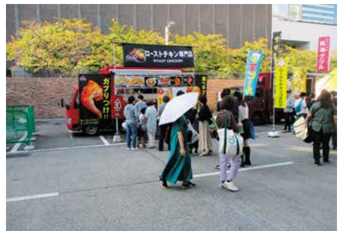
キッチンカー (宮崎県宮崎市：ローストチキンココロギ)