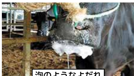
泡のようなよだれ

飼養牛に異常(発熱、食欲不振、よだれを流す、口・蹄・乳房の水ぶくれ、乳量低下等)が認められたら、かかりつけの獣医師もしくは最寄りの家畜保健衛生所へ連絡する。