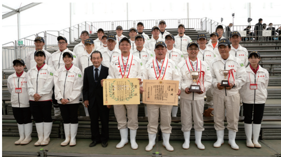
第12回全国和牛能力共進会宮崎県出品者