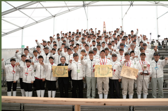
第12回全国和牛能力共進会宮崎県出品者及び関係者